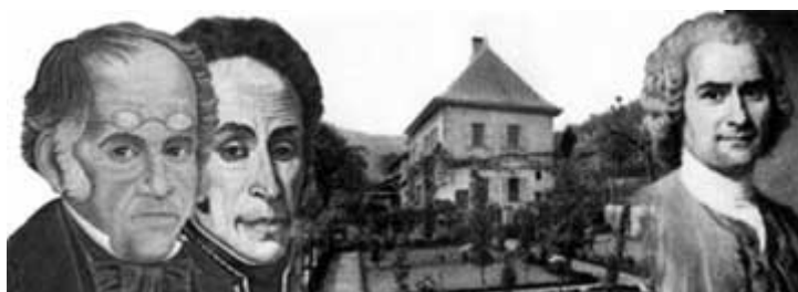
Rodríguez Bolívar Chambéry Rousseau

Bolívar acepta la invitación de su maestro para recorrer Europa, como una vez éste lo hizo a pie... Como escribió Uslar Pietri: Aquellos dos peregrinos venían desde París, con la cabeza bullente de las ideas de la Revolución Francesa y con los ojos deslumbrados por las ceremonias imperiales de la coronación de Napoleón. Venían del agitado escenario de la historia reciente para entrar en los vestigios de la historia romana, donde Bolívar hará aquel juramento inmortal, que dará brillo a la independencia de América.