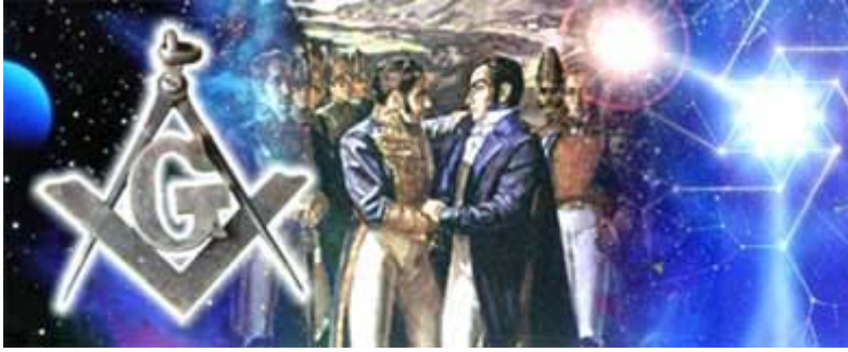
Bolívar y Morillo

El abrazo y el saludo entrecruzado de las manos entre los masones, es símbolo de la fraternidad y la hermandad que obliga a los integrantes de la Gran Logia... Suele ser parte de una ceremonia de reconocimiento, reconciliación, de fe y esperanza, que se ejecuta con una característica propia que sólo los masones saben reconocer.